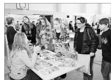
Agraset mit ehemaliger Schülerin als Azubi