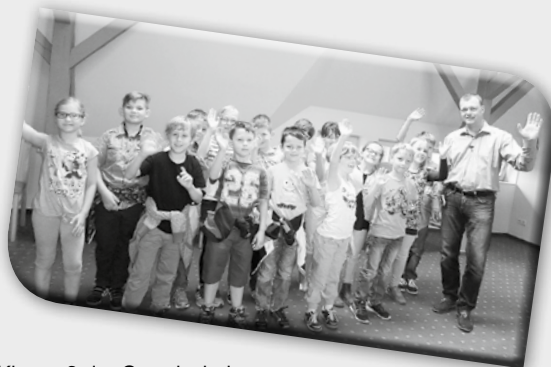
Klasse 2 der Grundschule Ottendorf zu Besuch im Rathaus